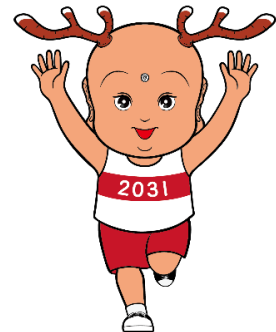
奈良県マスコットキャラクター「せんとくん」