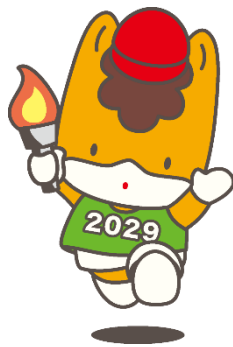
大会マスコットキャラクター「くんまちゃん」