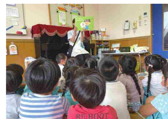
SDGsの紙芝居で読み聞かせ

昨年度からプリントをペーパーレスにしたことをきっかけにSDGsについて意識して取り組んでいます。県が行うSDGsの研修に職員が出席したり、SDGsの紙芝居を購入して読み聞かせをするなど、日々の保育の合間に意識的に子供たちにSDGsを教えていけるよう工夫しています。