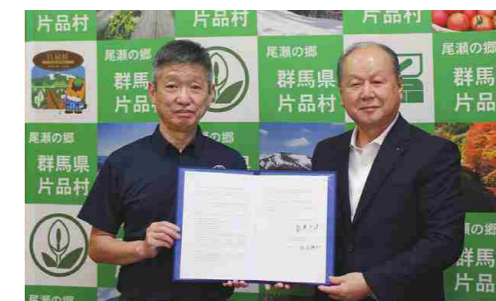
地域づくりに関する包括連携協定