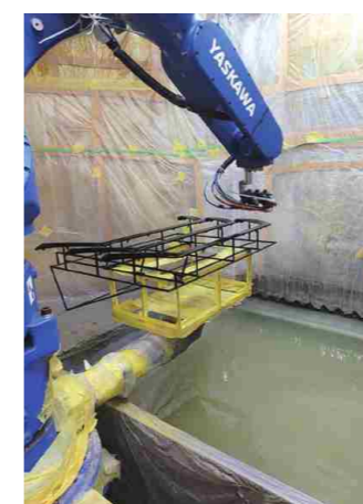
ロボット制御により 均一化された塗装を実現

この水性塗装の試作および量産での実用化が当社へ求められています。当社では、群馬産業技術センター、塗料メーカーの協力のもと、水性塗料の実用化に向けて、実証実験を行い、新技術の確立を行っています。水性塗料では、塗装むらの発生を抑えるために、より均一な厚みの塗装被膜の管理が要求されます。現状、熟練者は、一般作業者では実現できない微妙な調整を加えながら高度な品質を実現しています。