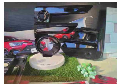
高い品質を追求した塗装品

SDGsに貢献するため、自動車生産工程において排出されるVOC、CO2による大気汚染および地球温暖化への影響抑制に向けた塗装技術の取組では、有機溶剤系塗料ではなく、水性塗料の使用が求められます。しかしながら、水性塗装は油性と比較して仕上がりが品質に対する難易度が高いです。その理由は、塗料の溶媒の乾燥速度が塗装品質に影響を及ぼすところ、溶媒に水を用いる水性塗装では乾燥が遅く、塗装にむらができやすいためです。