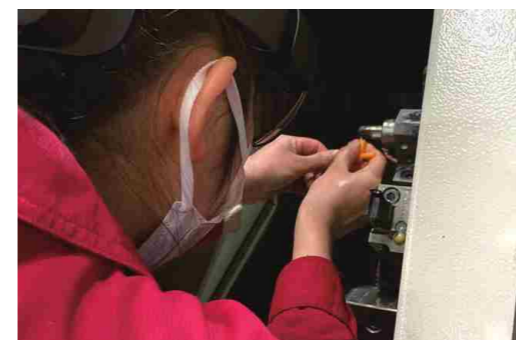
ホロレンズを使用した取り組み

また、現場作業の教育では、現行の手順書を動画に置き換えホロレンズを活用して実際の作業を皆で確認し合うなど、外国人労働者でもわかりやすく覚えられるように新たな取組にチャレンジしています。