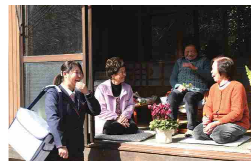
ヤクルトレディによる地域の見守り