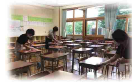
担当地域内の学校で消毒作業をサポート