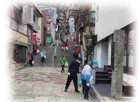
地域のみなさまとともに清掃活動