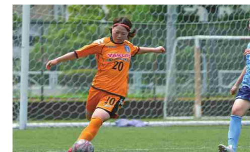
スポーツに取り組む社員へのサポート