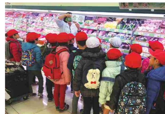
小学生の食育体験ツアー