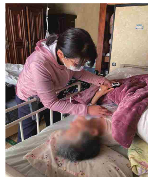
訪問時の支援の様子

これからも様々なケースから、謙虚に学び、看護の振り返りをしながら、看護のレベルを向上させていきたいと考えています。