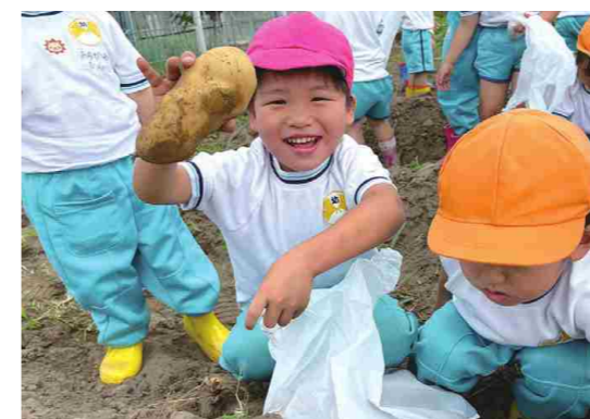
じゃがいも掘りの様子

すみよし幼稚園は「外で遊ぶ」ということを非常に大切にしており、戸外遊びの中から植物に触れ、虫に触れ、幼少期ならではの自然とのふれあいから自然の尊さを学んでいます。その中でも特にSDGsと関連が深いと感じているのは、例年地域の畑をお借りして行っているじゃがいも掘りです。認定こども園への移行に伴い完全給食となった中で、掘ったじゃがいもは給食で食べています。こうした食育活動なども積極的に行っていくことで、子供たちは日々自然のありがたみ、貧困問題について考えています。