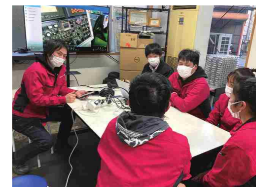
現場作業員のディスカッション