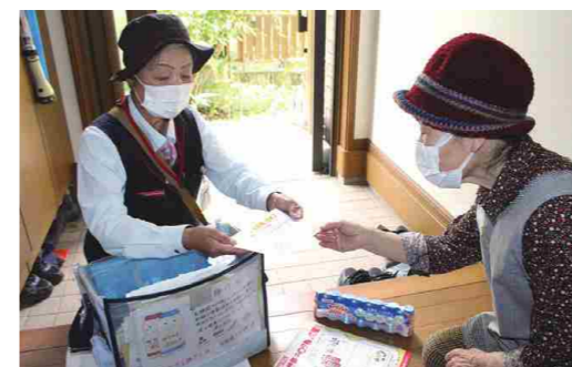
ヤクルトのお届けと健康情報の提供