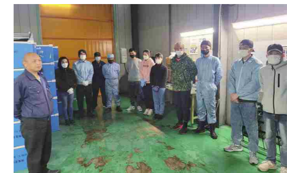
従業員がやりがいを感じられる職場を目指している

そこで、実際に塗装した時の塗膜測定を行い、データ化することで、熟練者による水性塗料独特の微妙な調整が見える化する塗装技術の確立を目指しました。実験では、立体的な形状を持つ製品に対して、塗装経験10年以上の熟練者、5年程度の一般作業者にて塗装実験を行い、膜厚のばらっきの評価を実施。その結果である評価データを水性塗装の品質が保たれる管理値として指標化し、ロボット制御のティーチングに反映させることで、ばらっきの小さい均一化された塗装を実現しました。