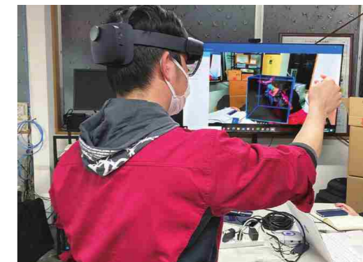
ホロレンズによってMR(複合現実)を体験できる