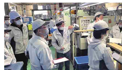
DX・IoTデータを活用して不良削減に向けた成形トライ