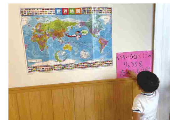
いろいろな国の料理を楽しむ

また、様々な事情から一時的にお子様を預けたいという方や、教育活動を体験したいという方に向けて一時預かりや未就園児教室なども行っています。年々ニーズが高まっている背景を見ると、子育ての面からこの地域がずっと住み続けたいまちとして皆様に思っていただけのためには、これらの子育て支援活動は不可欠なのではないかと感じています。