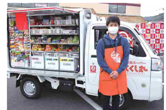
移動スーパーとくし丸