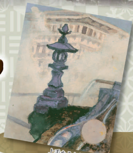
上毛かるた新版原画