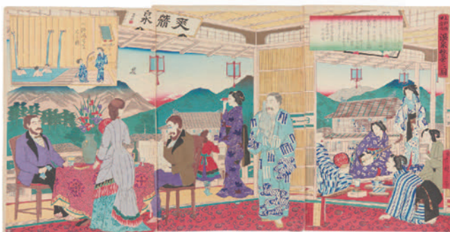
上野国伊香保温泉繁栄之図