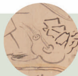
江戸時代の絵図に残る温泉マーク資料も展示