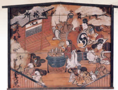
日向見葉師堂絵馬 (宗本寺)