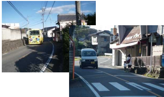
道路幅狭小・歩道未整備