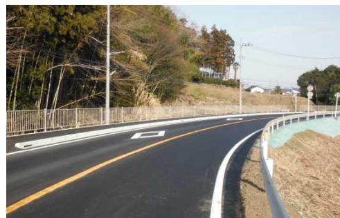
完成後のイメージ