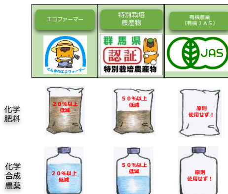
環境への負荷低減した農業の取組