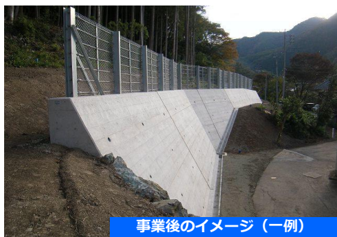
事業後のイメージ(一例)

◆ 擁壁をつくることにより落石や崩落した土砂を受け止め、がけ崩れによる被害のリスクを軽減します。