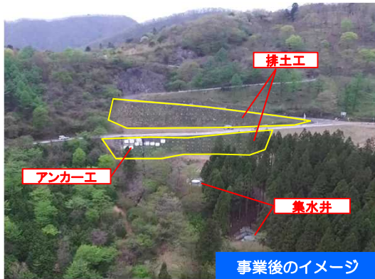
事業後のイメージ