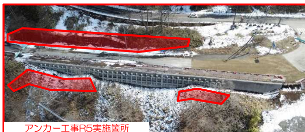
アンカー工事R5実施箇所