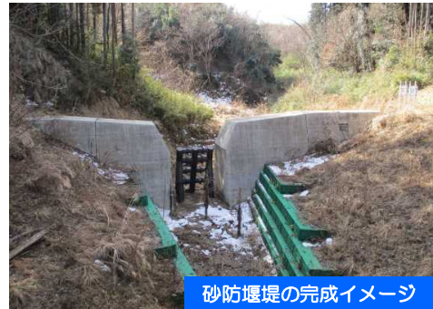
砂防堰堤の完成イメージ