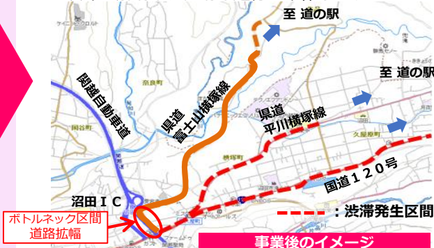
事業後のイメージ