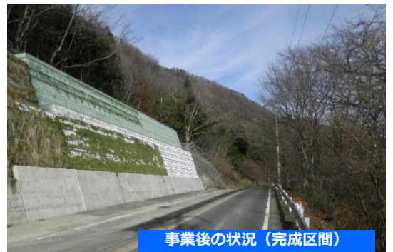
事業後の状況 (完成区間)

◆落石防護の施設により道路への落石を防ぐことで、緊急輸送道路の寸断リスクを軽減します。