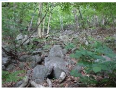
斜面上部の転石状況

◆斜面の浸食が進み、大雨等の際に落石や土砂崩落により道路が寸断するおそれがあります。