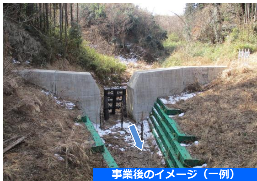
事業後のイメージ (一例)

◆砂防堰堤の整備により、大雨などによる土石流や流木による被害のリスクを軽減します。