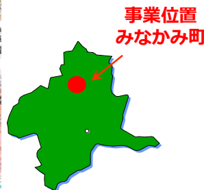
事業位置 みなかみ町