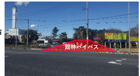
クリーンセンター交差点