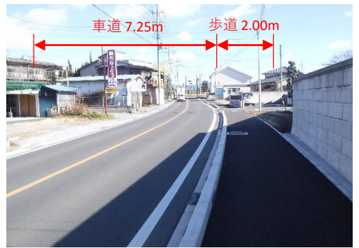
事業後のイメージ（一例）