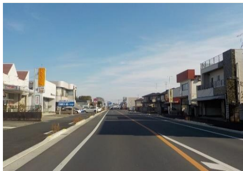
事業後のイメージ（一例）