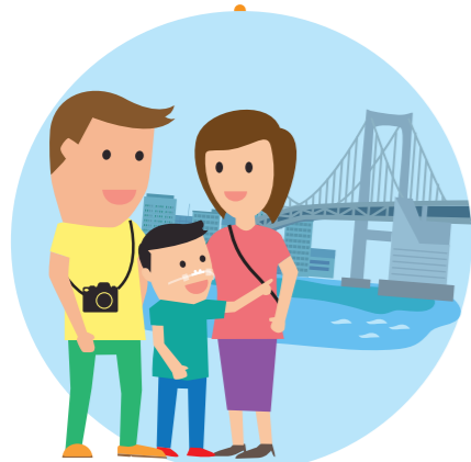
医療的ケア児等とその家族