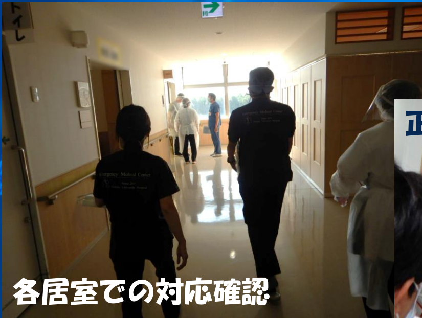
各居室での対応確認