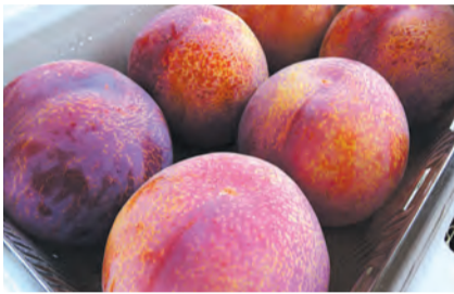
昨年度知事賞を受賞したプラム