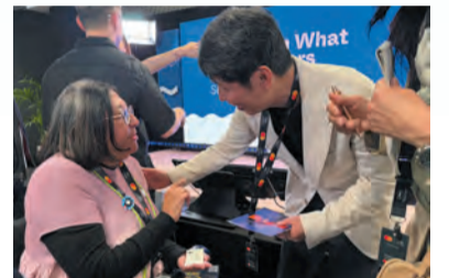
登壇後、聴講者と交流する山本知事(右)

今後も「人材育成」「企業集積」「情報発信」の3つを柱として、デジタル・クリエイティブ産業の創出に向け全力で取り組んでまいります。