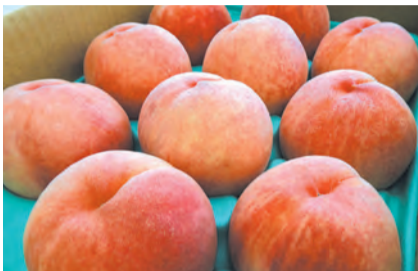
昨年度知事賞を受賞したモモ