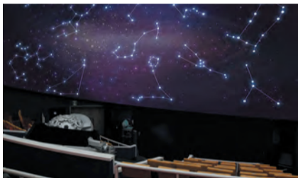
プラネタリウム(イメージ)