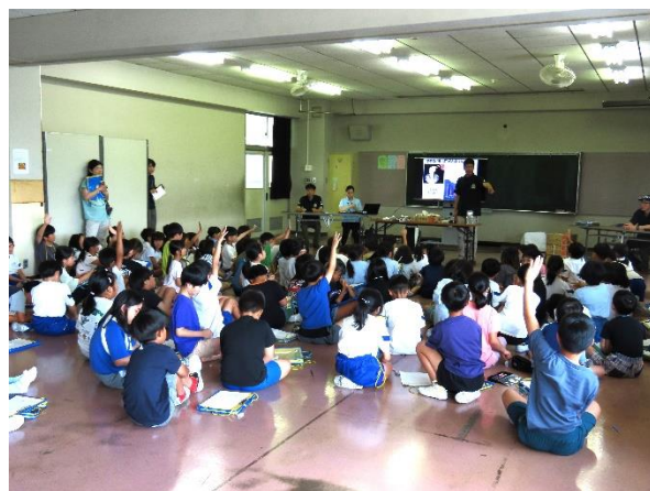
※写真は昨年の学習会の様子