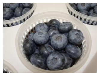
昨年度上位入賞品