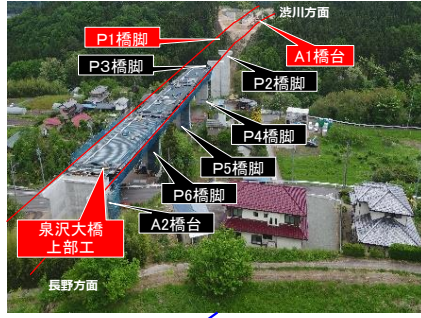
泉沢大橋 施工状況 (R8.05撮影)