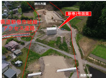
新巻IC付近 施工状況 (R8.05撮影)