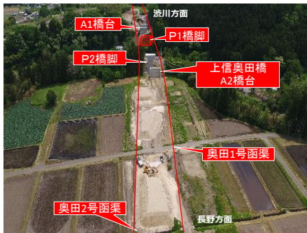
奥田地区 施工状況 (R8.05撮影)