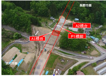
上信小泉橋 施工状況 (R8.05撮影)