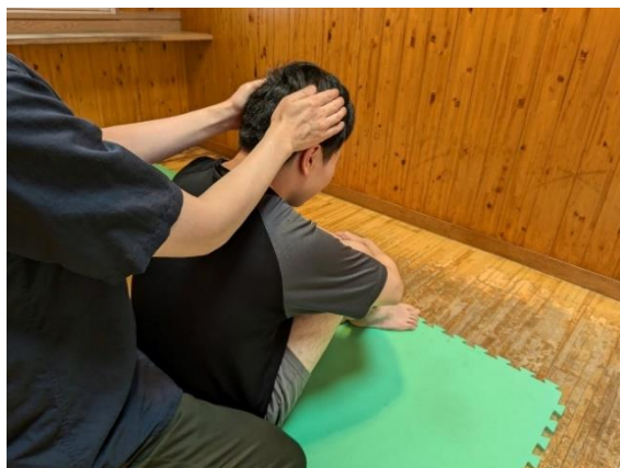
～頭のとけあいの様子～