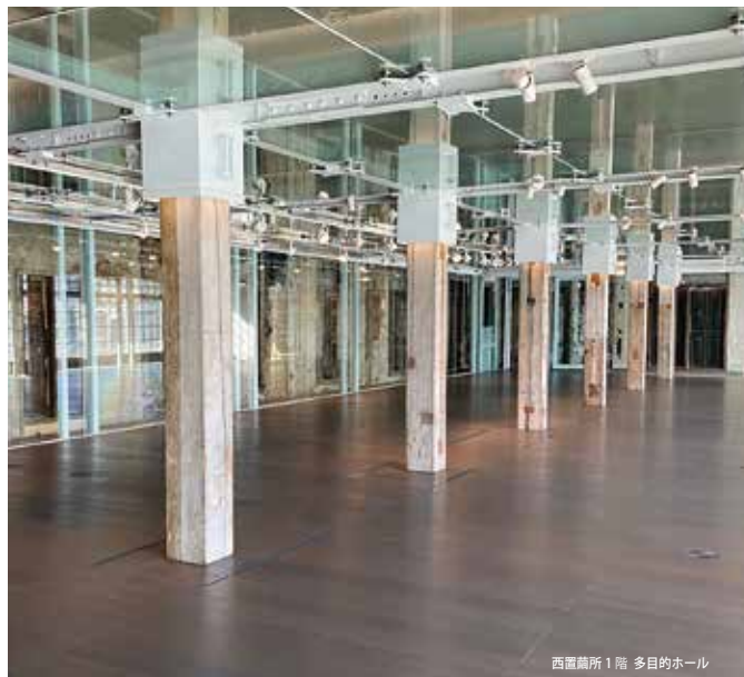
西置繭所 1 階 多目的ホール

作家達の紡ぐ感性の糸が、張り巡らされ、震え、響き、ざわめくこの空間を是非お楽しみください。