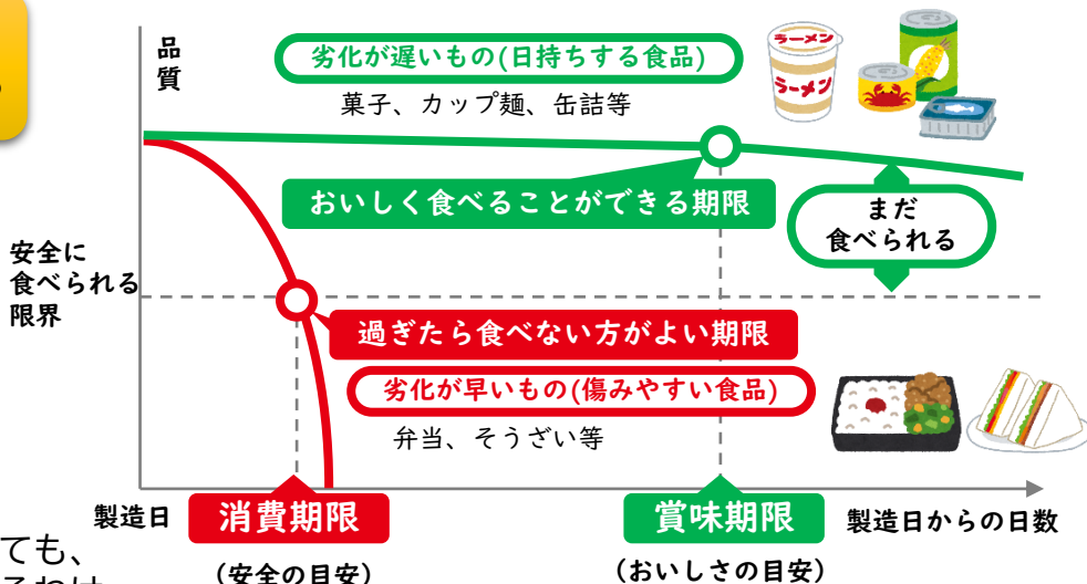
【消費期限と賞味期限のイメージ図】

賞味期限を過ぎた食品であっても、必ずしもすぐに食べられなくなるわけではありません。