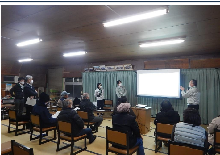
【東町区】第1回道づくり会議の様子(2月19日)