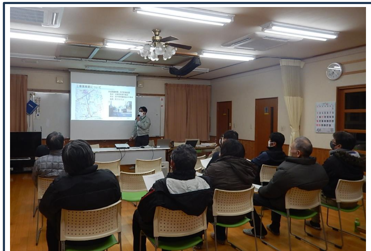
【下区】第1回道づくり会議の様子(2月21日)