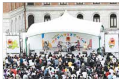
昨年度開催の様子