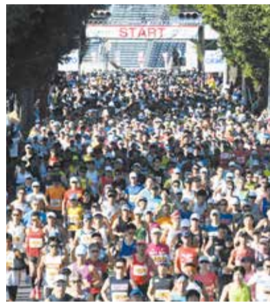
昨年度開催の様子

問 ぐんまマラソン実行委員会事務局(☎027-254-4992)、県庁スポーツ振興課(☎027-226-2081)