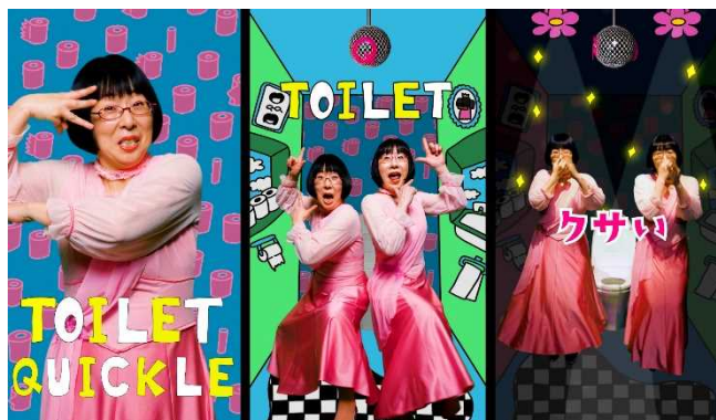
■ WEB 広告/花王クイックル トイレット・ロマンス