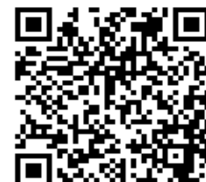
令和5年度採択事業詳細

※令和4・5年度採択事業者が応募する場合、昨年度から実証フェーズが進んでいること。