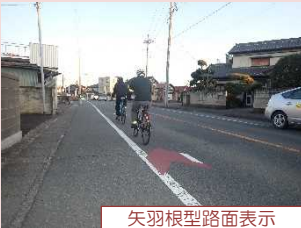
矢羽根型路面表示

自転車専用の通行位置の路面表示や自転車通行帯を整備し、自転車利用者の安全性向上を図ります。