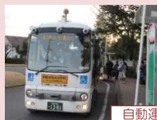
自動運転実証実験

深刻化する運転手不足に対し、将来にわたってバス路線を確保・維持するため自動運転技術の開発・普及を促進します。