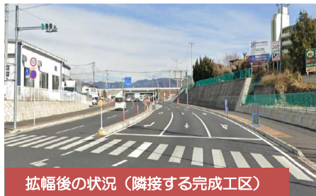
拡幅後の状況（隣接する完成工区）

拡幅（4車線化）により、渋滞の緩和や歩行者・車両の安全で快適な通行空間を確保します。