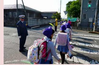
交通指導員活動状況