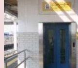
エレベーター設置

誰もが鉄道を利用することができる環境整備のため、駅のバリアフリー化や駅舎整備を支援します。