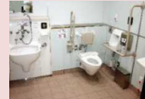
高齢者・障害者対応トイレ