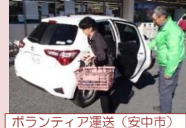
ボランティア運送（安中市）

パーソントリップ調査結果やバスロケーションシステムの運行データなどを活用して、地域の生活スタイルに合わせた路線網や移動手段の見直しを支援します。