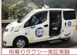
相乗りタクシー実証実験

新たな移動手段の導入可能性について検討し、配車アプリなどICT技術の活用も含めた実証実験を通じて市町村等への導入を支援します。