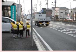
通学路の歩道整備

通学路においては、合同点検結果を踏まえ、重点的に安全な歩行空間への改善を行います。