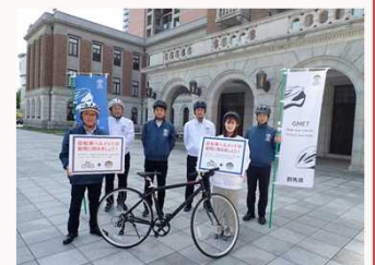
県職員啓発チーム「GMET」

手軽に使えて、環境にも優しい「自転車」を、ルールやマナーを守って楽しく利用してもらうため、県職員啓発チーム「GMET」による活動を実施しています。駅や大型店舗でのヘルメット着用啓発や、民間企業と連携した自転車利用促進活動を実施しています。