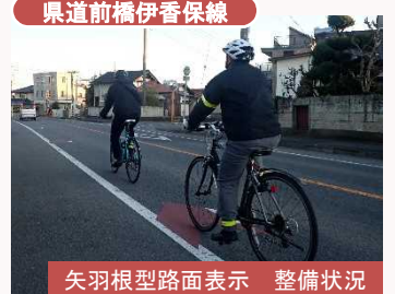
矢羽根型路面表示 整備状況