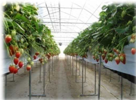
いちご高設栽培システム