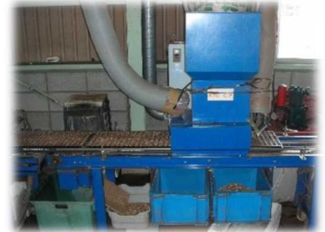
セル成型苗用全自動播種機