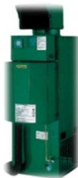
二酸化炭素施用装置*4