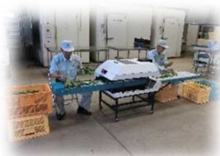
軟弱野菜調製機 (群馬県開発)