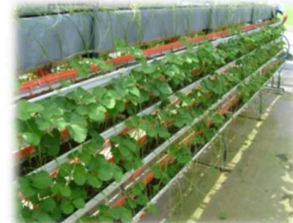
いちご高設採苗システム