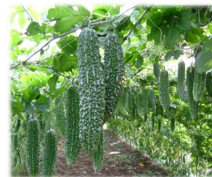
にがうりネットハウス