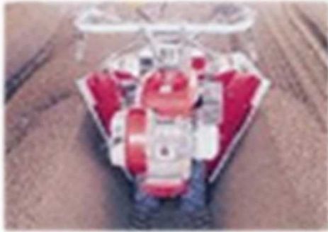
いちご畝立て成形機