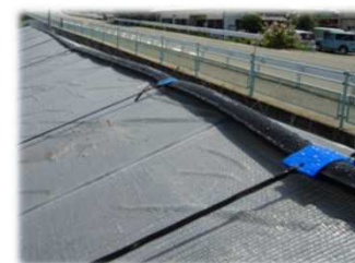
屋根散水装置(群馬県開発) *3