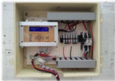
自動かん水装置 (群馬県開発 トマト、キャベツ)