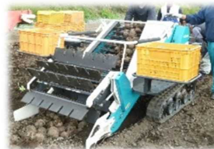
野菜用収穫機(キャベツ、ほうれんそう、ねぎ、たまねぎ、だいこん、えだまめ)