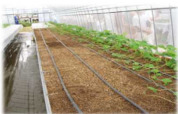
地域開発型いちご 簡易高設栽培・育苗システム