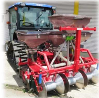
新型三兼ライムソワー