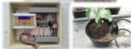
自動かん水装置(群馬県開発 トマト、キャベツ) 日射比例自動かん水装置、トマト養液土耕システム