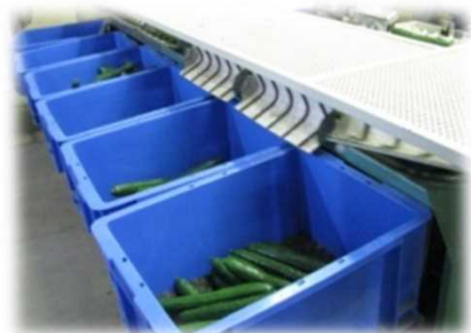
きゅうり小型選別機 (群馬県開発)