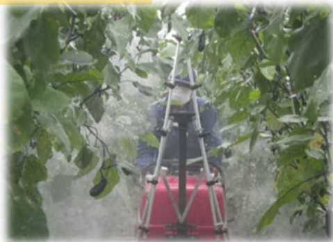
クローラ防除機(なす)