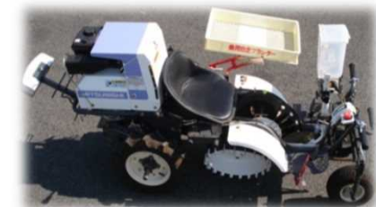
移植同時粒剤植穴施用装置 (群馬県開発)