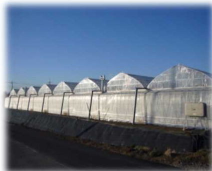
鉄骨パイプハウス (エコノミーハウス)