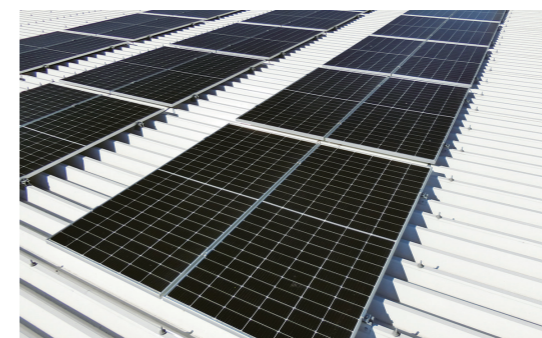
自家消費型太陽光発電

①自家消費型太陽光発電を導入し、使用電力の30%程度をまかなっております。また照明のLED化や、屋根に遮熱塗料を塗布し冷暖房熱効率を向上させ省エネを実現しています。