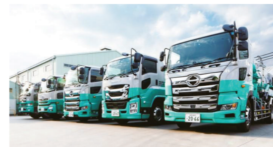
廃液の回収・清掃する車両を多数所有しているためお客様に迅速に対応できます。

当社のCO2排出量の8割が自動車やトラックの燃料使用によるところが大きく、エコドライブの推進やハイブリット車の積極導入を行いエコアクション21にて定める目標に対して10%の削減を達成しました。