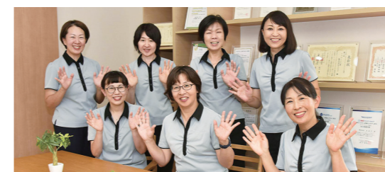
活躍する女性スタッフ

現在、女性従業員の比率は64%。女性の能力が発揮できる会社づくりを目指しています。高機能トイレ・シャワールーム等の環境整備、業務に関わる資格取得の支援、多様な働き方への対応等、全ての社員が働きやすい職場づくりを実現します。