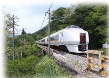
観光を支える主要交通網