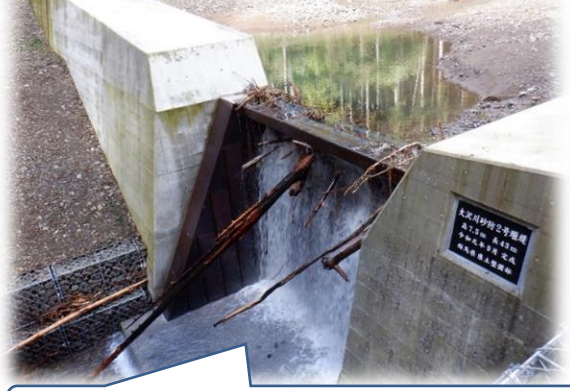
堰堤完成からわずか1ヶ月後に土石流を捕捉