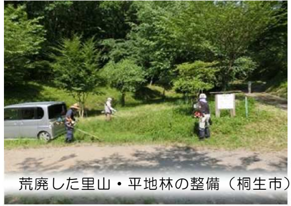
荒廃した里山・平地林の整備（桐生市）