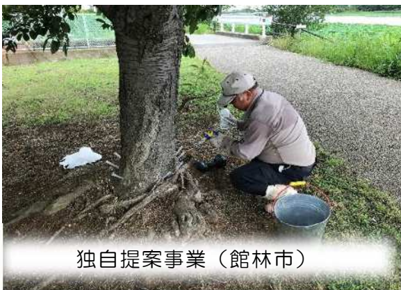
独自提案事業（館林市）