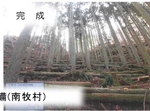
条件不利地森林整備(南牧村)