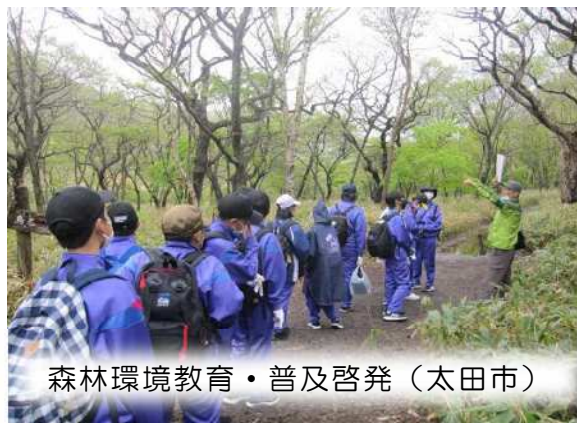
森林環境教育・普及啓発（太田市）