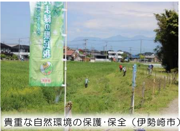
貴重な自然環境の保護・保全（伊勢崎市）