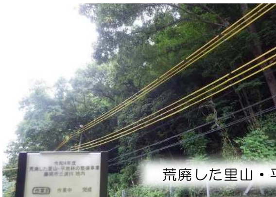
荒廃した里山・平地林の整備（藤岡市）