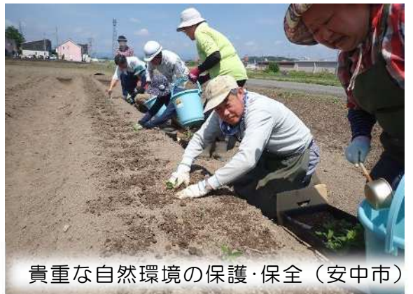
貴重な自然環境の保護・保全（安中市）