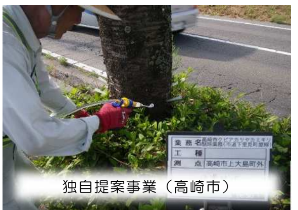
独自提案事業（高崎市）