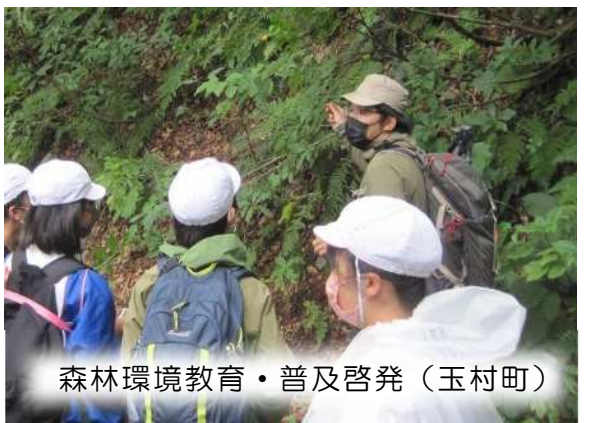
森林環境教育・普及啓発（玉村町）