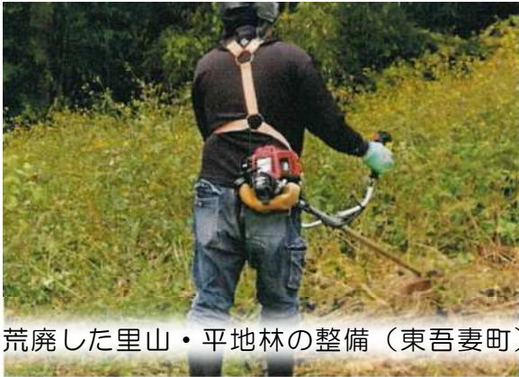
荒廃した里山・平地林の整備（東吾妻町）