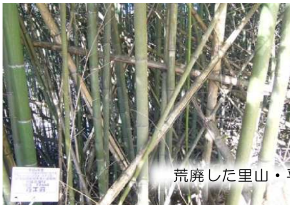
荒廃した里山・平地林の整備（昭和村）