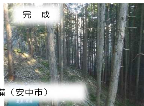
条件不利地森林整備(安中市)