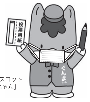
群馬県のマスコット 「くんまちゃん」