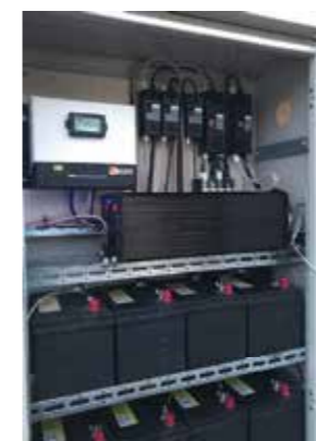
電気エネルギーを貯蔵する蓄電池(下部)、使用するための変換器[インバーター](中央部)、充電用のコントローラー(上部)