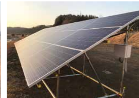
電気エネルギーを創成する太陽光パネル(単管設置)