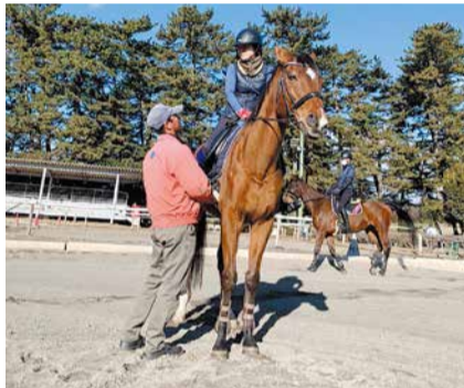
インストラクターが丁寧にサポートします

日 4月29日(月)までの希望する4回 ※火曜日を除く 開始時刻 午前9時、10時15分、11時30分、午後1時30分、2時45分 所 林牧場群馬県馬事公苑(前橋市富士見町) 対 当苑を初めて利用する、小学3年生から70歳までの乗馬初心者 定 各20人 先 ¥ 一般=1万8千円、高校生以下=1万4千円(受講料、保険料など) 受 4月15日(月)まで ※火曜日を除く 申し込み方法 電話予約後、所定の申込用紙 問 林牧場群馬県馬事公苑(☎027-288-7002)