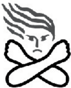
女性に対する暴力根絶のためのシンボルマーク

国連が定める「女性に対する暴力撤廃の国際デー（11月25日）」に合わせ、毎年全国で取り組まれている運動です。今年度も群馬県では、ぐんま男女共同参画センターでのパネル展示や、昭和庁舎をシンボルカラーである紫色にライトアップする取組などを行いました。今後も関連団体等と連携しながら、女性に対する暴力の根絶に向けて取り組んでいきます。