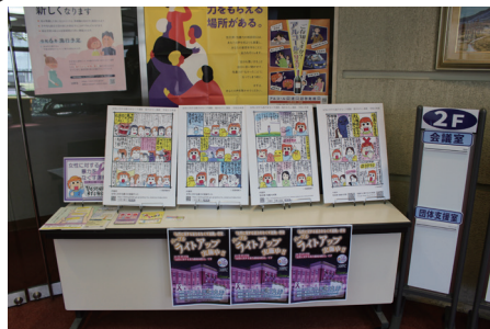
ぐんま男女共同参画センターのパネル展示