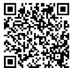
県ホームページ QR コード