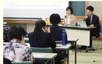
ナビゲーターの二人