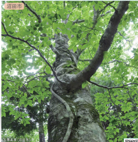
沼田市 玉原高原(沼田市) 周遊マップ C-3

開拓により生み出された大地には、こんにやく畑やレタス畑が見渡す限り続いています。夏にはこんにやく畑が緑の大海原のように広がり、レタス畑では朝どれレタスの収穫作業が未知から行われます。