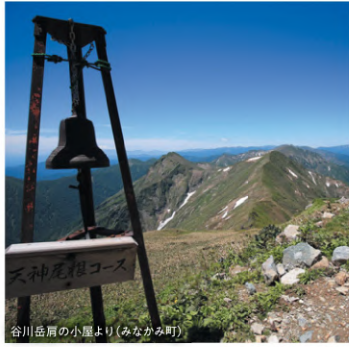
谷川岳麓の小屋より(みなかみ町)

「ぐんま県境稜線トレイル」は、群馬と新潟・長野の県境稜線約100kmを主要ルートとするロングトレイルで、国内で最長の稜線の長さです。利根沼田地域においては、谷川岳などがルートに含まれています。