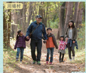
川場村 後山古道 周遊マップ D-4

一ノ倉沢は日本三大岩場の一つ谷川岳の最も有名な岩壁です。人々(アルピニスト)を惹きつけてやまない大絶景は一見の価値あり。ロープウェイが整備されているので天神平まで一気に登ることもでき、気軽に空中散歩が楽しめます。