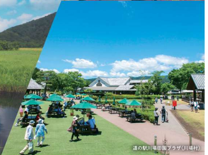
道の駅川場田園プラザ(川場村)