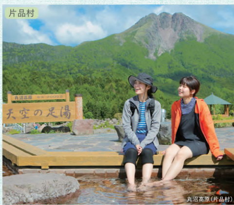
片品村 天空の足湯と日光白根山ロープウェイ 周遊マップ C-6

洪水期を迎える前にダムの放水設備が安全に作動するか確認するため「点検放水」が行われます。特に藤原・矢木沢・奈良俣・園原の各ダムでは、点検放水に併せて見学会を行っており、全国からダムマニア・土木マニアの方々が集まる一大イベントとなっています。