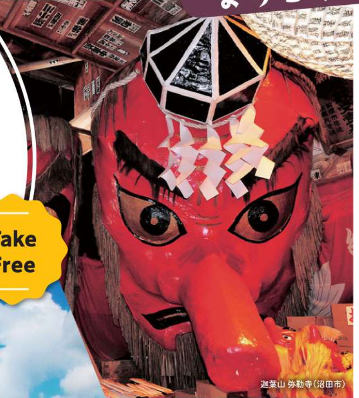
迦葉山 弥勒寺(沼田市)