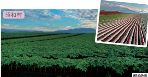
昭和村 こんにやく畑・レタス畑 周遊マップ E-3~4

国立公園特別保護地区、国の特別天然記念物、ラムサール条約湿地に指定されています。本州最大級の高層湿原である尾瀬ヶ原や、燧ヶ岳の噴火によりできた尾瀬沼には、ミズバショウやニッコウキスゲが咲くすばらしい自然がそのまま残されています。名曲「夏の思い出」にも歌われ広く知られています。