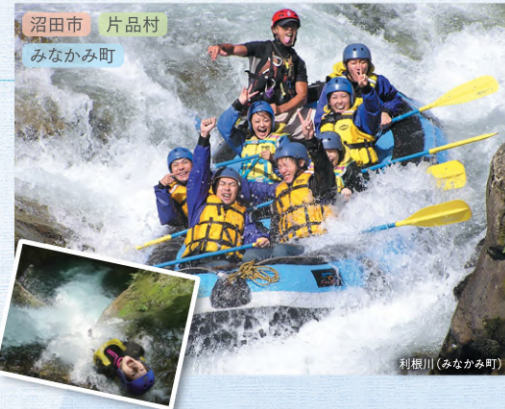
沼田市 片品村 みなかみ町