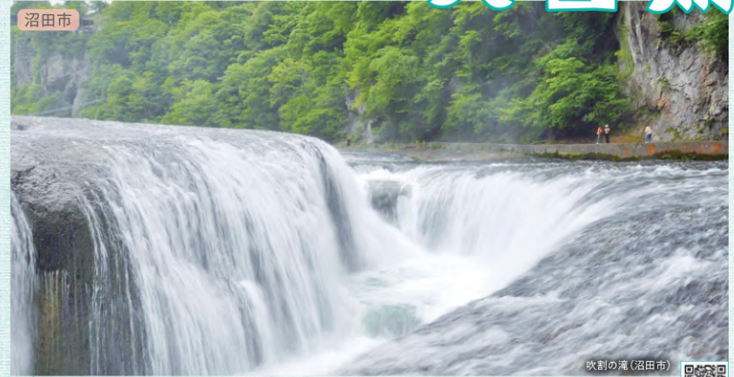
沼田市 吹割の滝 周遊マップ D-5

周辺にはブナの巨木が林立する「ブナ平」が広がり、春には新緑を、夏には木陰の涼しさを、秋には素晴らしい紅葉をそれぞれ楽しむことができます。首都圏から最も近いブナ林です。