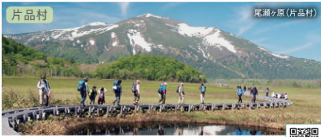
片品村 尾瀬ヶ原(片品村) 周遊マップ B-5~6

日本の流域面積を誇る坂東太郎「利根川」。利根川の源流はみなかみ町の大水上山と言われ、そこからあふれる一帯が片品川や薄根川といった流れと合わさって大河となっています。ダイナミックな自然が残りつつ、実はアクセス抜群の利根沼田地域を訪ねてみませんか？