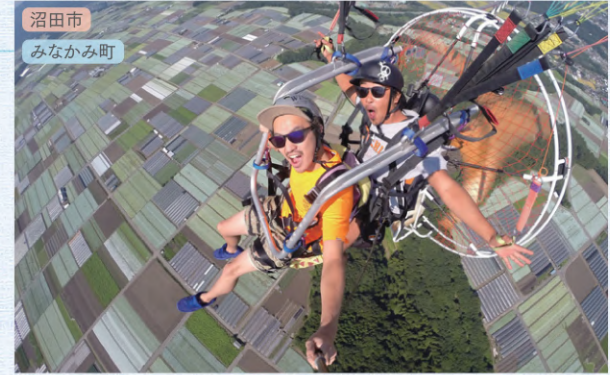
沼田市 みなかみ町