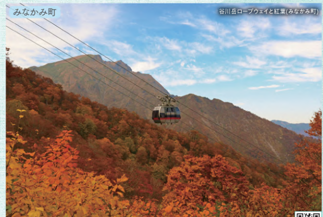
みなかみ町 谷川岳ロープウェイと紅葉(みなかみ町) 周遊マップ C-2

日本百名山のひとつで、標高2,578mを誇る関東以北では最高峰です。山頂からは周辺の山々や五色沼や丸沼といった美しい湖沼も広がります。なお、標高2,000mまでロープウェイで一気にかかる、「日光白根山ロックガーデン」があり、眺望抜群な「天空の足湯」も人気のスポットです。また、「天空のテラス」「天空のカフェ」もおすすです。