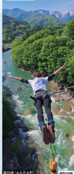
諏訪峡(みなかみ町)