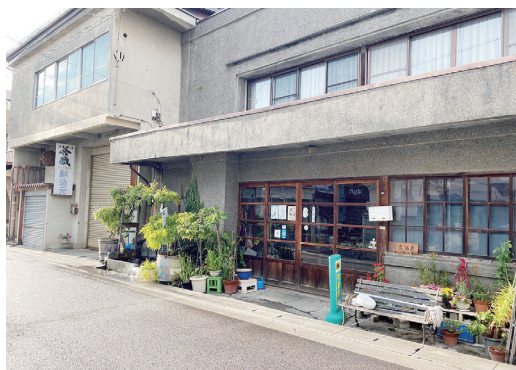
松本市街地に残る最後の酒造所「善哉酒造」