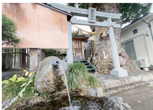
古来より和歌にも詠まれ都(みやこ)にも知られた槻井泉神社の湧水