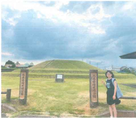
「人面付円筒輪」と 「盾持ち人」