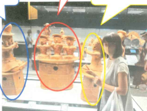
正座し祭具を捧げる巫女