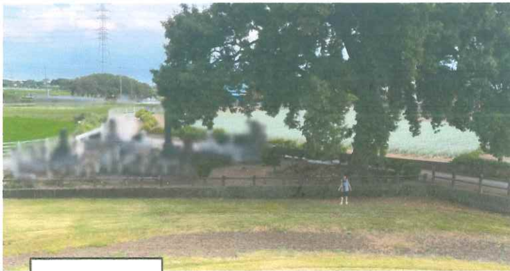
「水鳥形埴輪」「馬形埴輪」 「埴輪武装男子立像」 「笑う埴輪」「大刀形埴輪」 「大刀形埴輪2」「盾形埴輪」