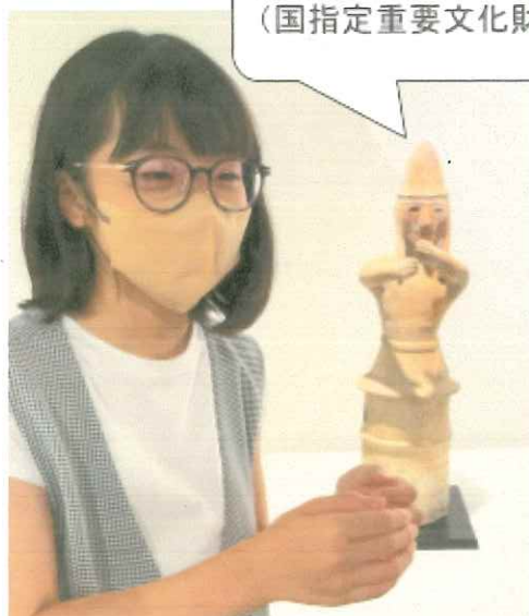
捧げ持つ男 (国指定重要文化財)

この「捧げ持つ男」も「盾持ち人」と同じように、「1:インターネットで調べる」で鉄棒(の支柱)にしたいと思っている埴輪です。