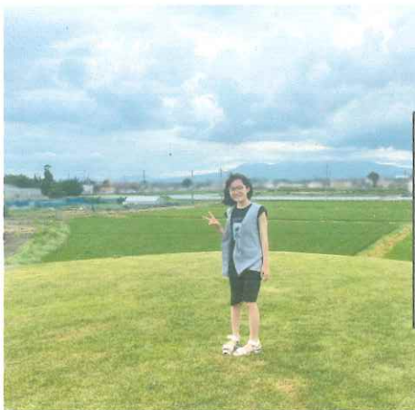
「高床寄棟造 の家形埴輪」 のコンビネー ション遊具