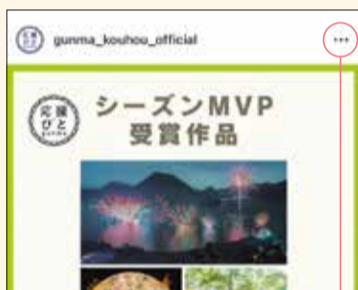
「お気に入り」の追加はこちらから

Instagramのホーム画面にはフォロー中のアカウントの他、自動で「おすすめ」の投稿が表示されます。「見たい投稿」を増やすには「いいね！する」「閲覧時間を増やす」他、「お気に入りに追加する」方法などがあります。