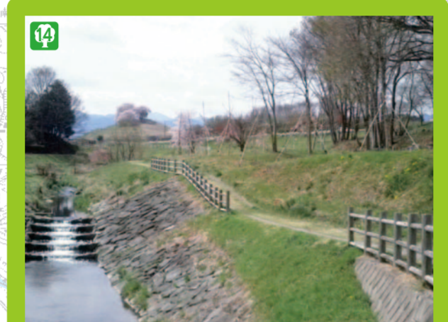
毛野国白石丘陵公園