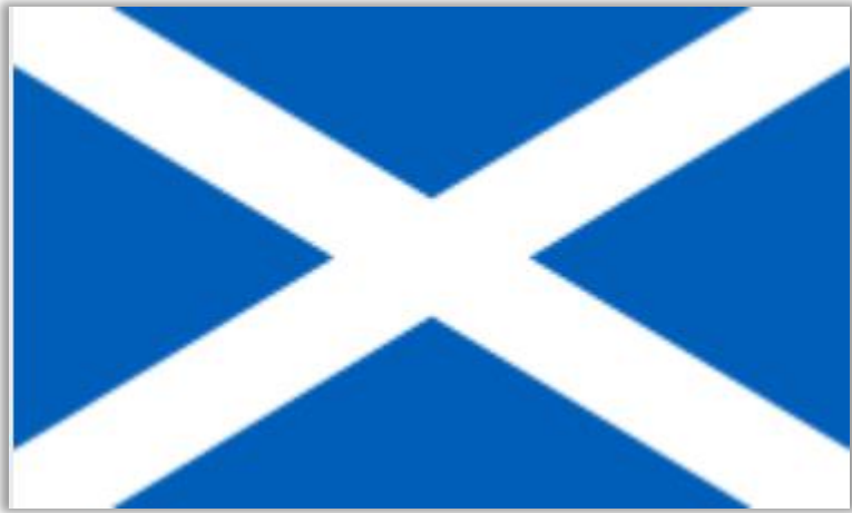
英国（スコットランド）