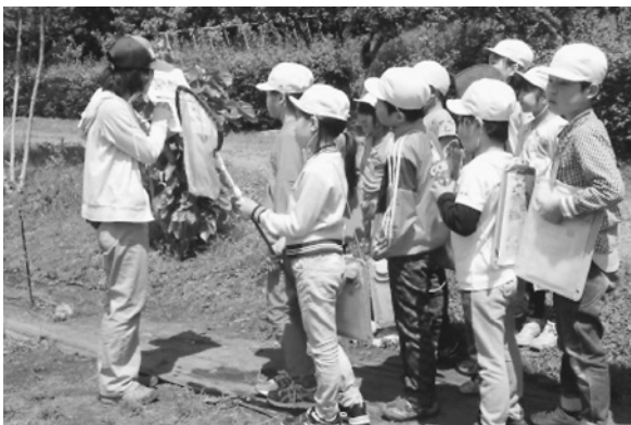
学校利用(野外解説)

理科や自然・環境についての学習を行う小学校等を支援するため、教員向け利用説明会や個別の下見などに対応するほか、「学校団体利用の手引き」を配布しています。また、学校利用に際して、野外に観察ポイントを設置するなど、学習ニーズに合わせたきめ細かなプログラムの相談に応じています。その結果、2022(令和4)年度は、15,237人の団体利用がありました。