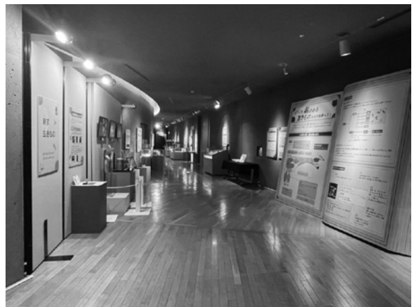
第67回企画展「毒のある生きもの大図鑑」

「毒のある生きもの大図鑑」では、有毒生物の生態、特に毒のある部位や毒をもつ起源について、生体展示・標本・写真・動画等で紹介しました。私たちは、主に「刺される」、「咬まれる」、「食中毒になる」、「体外へ出された毒に触れる」の4つの状況において被害にあうことが考えられます。今回の企画展では、この4つの状況に関連する毒のある生きものをそれぞれ紹介し、さらに、「食」や「薬」としての関わり方についても紹介しました。