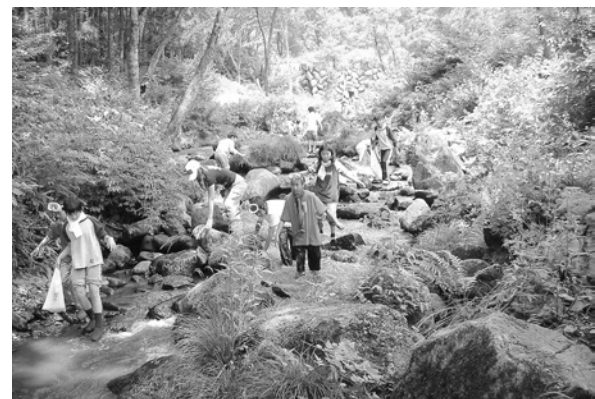
一級河川桜川 川場村

河川改修工事においては、設計時から地域住民の意見を取り入れるなどして、憩いの場を整備するなど、地元で親しまれる川づくりに取り組んでいます。