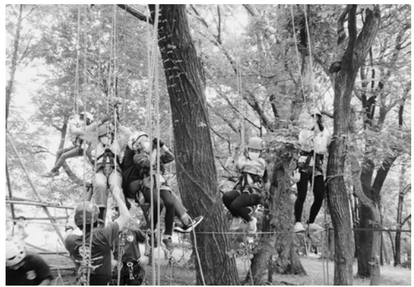
森林環境教育の様子

し、11,426名の方に森林の機能や重要性について学んでもらうことができました。