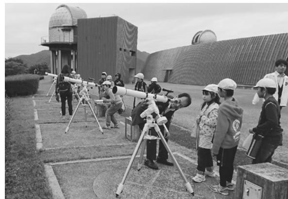
望遠鏡の使い方の学習

夜に光って見える星は、昼間には消えてなくなるわけではなく、太陽の明るさに負けて見えにくくなっているだけです。そのことへの気づきの場として、土日祝日の午前中に「昼間の星の観察会」を開催しており、惑星や1等星などの明るい星を望遠鏡で観察しています。また、昼間の星の代表格である太陽については、常設している太陽望遠鏡でリアルタイムの姿や黒点などを確認できます。夜の天体観望だけでなく、昼間の来館者にも天体に興味を抱いていただけるような工夫を行っています。