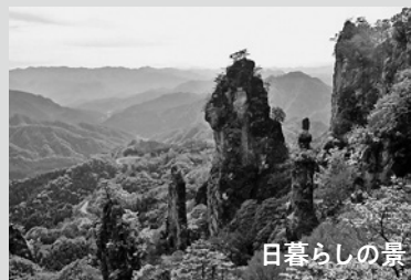
※日暮らしの景（上の写真） 日が暮れるまで見ていても飽きないことからその名が付けました。