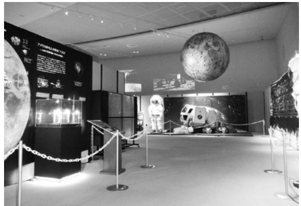
第66回企画展「宇宙への挑戦」

「宇宙への挑戦 season II 月よりも遠くへ」では、天体に関わる技術の進化や、小惑星から帰ってきた「はやぶさ」と「はやぶさ2」・天体観測・ロケット・人工衛星・探査機・宇宙ステーションなどの技術と調査からわかってきたことを紹介しました。さらに、隕石を素材とした刀「流星刀」の実物展示、昔から現在に至るまでの宇宙に関するあこがれ、技術、調査等も紹介しました。