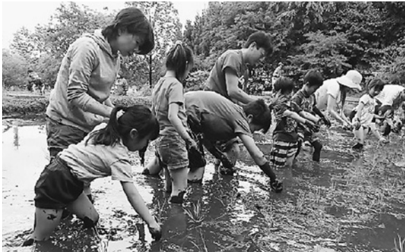
里山生活体験(田植)

め、下草刈りや園路整備を行い、日本人の原風景ともいえる「里山」を、かやぶき民家を中心に再現しており、自然と共生してきた暮らし方などを体験することができます。