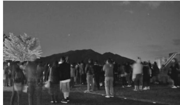
屋外での星空案内