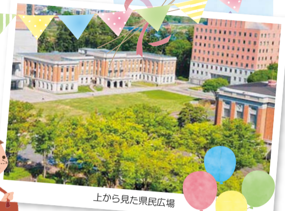
上から見た県民広場

◆ 県では、さまざまなイベントの開催や施設の有効活用により、県庁を楽しく身近な場所にして、県庁を起点としたにぎわいを創出していきたいと考えています。今年、芝生の上でのんびりとくつろげる「県民広場」や、人と人の交流を生み出すコミュニティスペース「GINGHAM」が新たに誕生しました。皆さんも生まれ変わった県庁に足を運んでみませんか。