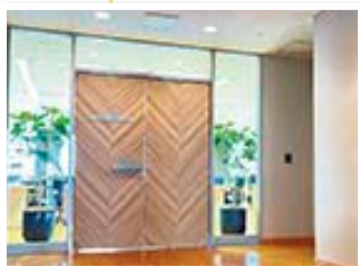
アクセンチュア・アドバンスド・テクノロジーセンター前橋

今年5月、世界49カ国でコンサルティング事業を手掛けるアクセンチュア株式会社が入居しました。