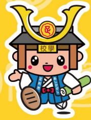
たかうじ君 (足利市)