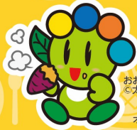
おおたんの 太田市 オーランドさん (邑楽町)