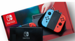
※Nintendo Switchのロゴ Nintendo Switchは任天堂の商標です。