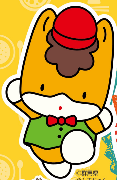
群馬県 ぐんまちゃん 00268 - 02