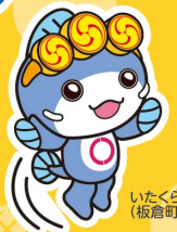
いたくらん (板倉町)