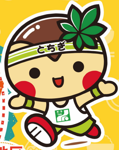
とちまるくん ©栃木県