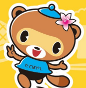
ぼんちゃん (館林市)