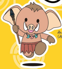
みどモス (みどり市)