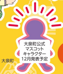
大泉町公式 マスコット キャラクター 12月発表予定 大泉町