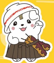
さのまるく 佐野市