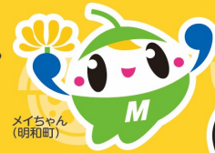
メイちゃん (明和町)

群馬・栃木両県にまたがる両毛地域「11市町」をめぐる、 ご当地のグルメや地域の魅力に触れることができるイベントです。 しかも、豪華な賞品もご用意!ご家族と、お友達と、 はたまたお一人で、両毛をとことん堪能してください!!