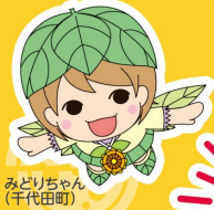
みどりちゃん (千代田町)