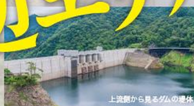
上流側から見るダムの堤体