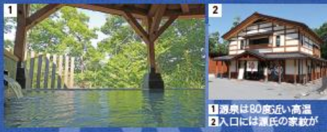
1 源泉は80度近い高温 2 入口には源氏の家紋が

露天風呂から木々の間に湖 が見える共同浴場。若干の 硫黄臭はありますが無色透 明の湯は昔と同じく関節痛 や筋肉痛に効能あり。