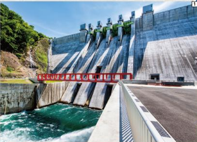
①ダム堤体を下から見上げる ②広々としたハッ場ダムの堤頂 ③湖に突き出した展望スポット「やんば見台」