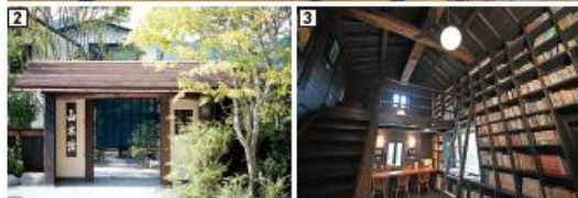
1 古たつがよい雰囲気。客室の窓の外は湖 2 宿の創業は1661年。多くの文人墨客 が宿泊した 3 古い蔵を改造して造られた図書室。宿泊客は無料で利用できる 4 美しい紅葉を露天温泉から眺める 5 暖炉のあるラウンジスペース