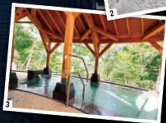
(写真はトリミング加工しています)