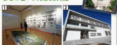
①ハッ場ダムの歴史をたどる展示。中央には巨大なジオラマが②ハッ場湖を望む建物③ダムカードの入手もここで

1階はハッ場ダム誕生の背景から工事、そしてダム完成にいたるまでの歴史をパネルや映像などでたどります。2階はダムの構造や周辺の地理、そしてダムの役割を模型などで解説しています。