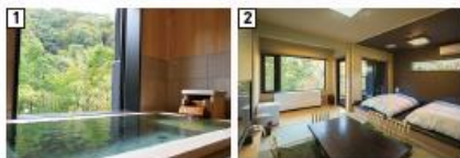
1 男女別の大浴場のほかに貸し 切りの浴室も用意 2 6つの客室 はすべて内装が異なる 長野県原町川原湯490-12 0279-83-2121

和モダンを基調とした6つの客室や温泉の窓から望む 四季折々の自然が美しい。温泉に加えて、地元食材をふん だんに使った「田舎料理」がうれしい。