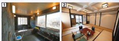
1 大きな窓から景色も楽しめる 浴場 2 部屋数は全部で4つ。静 かに過ごすのにちょうどいい 長野県原町川原湯454-51 0279-83-2408

温泉街でダムに一番近い場所にある。自家菜園で収穫 された新鮮な野菜が供される食事は宿の自慢のひとつ。 隣接する工房で陶芸体験もできる。