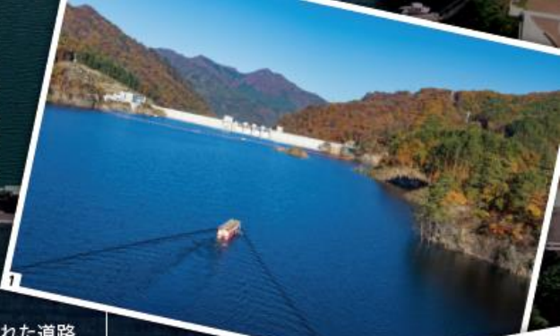
1 ハッ場あがつま湖。ダム湖が観光拠点になっている。2 1947年カスリーン台風で爆発した増玉県架橋周辺。3 800年以上の歴史がある川原湯温泉

豊かな自然や温泉など、これまであったものに加えてハッ場ダムという新たな顔をもったこのエリア。今後ますますの発展が期待できそうです。