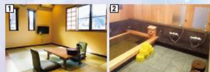
1 客室は全部で2部屋。民宿は 山水という名前になる 2 源泉か け流しでヒノキ風呂 長野県原町川原湯485-8 0279-83-2447

居酒屋のある民宿。食事つきのプランもあるが、メニュー 豊富な居酒屋で飲食をしてそのまま民宿に泊まるとい うパターンも。もちろん温泉もあり。