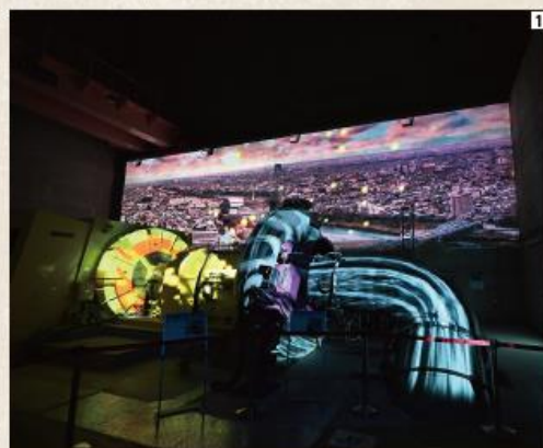
①実際の発電機にプロジェクションマッピングで映像を投影して発電の仕組みを説明 ②見学ツアーの前のガイダンス

ダムの重要な施設である発電所の内部を無料で見学できる。ツアーが催行されるのは毎週金~月曜までの4日間と祝日(年末年始を除く)。見学時間は1回約30分、1日5回(受付時間:10時、11時、13時、14時、15時)。小学生以上が対象となる。予約は不要で、上記の受付時間にハッ場発電所の入口で申し込む。