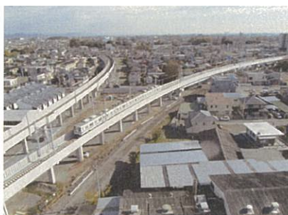
■高架化されたJR両毛線と東武伊勢崎線