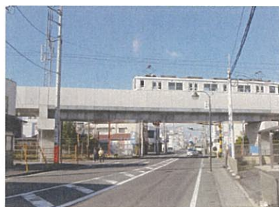
■高架化により除却された踏切

平成25年10月19日に東武鉄道の高架切替を記念して、東武伊勢崎駅で完成式典やイベントなどが開催されました。当日は関係者や多くの地元の方々に参加いただき、盛大に式典などが執り行われ、「ぐんまちゃん」や東京スカイツリーからは「ソラカラちゃん」もお祝いに駆けつけてくれました。