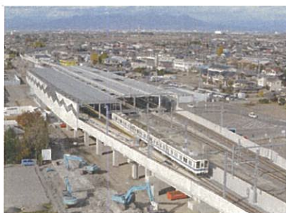
■高架化された伊勢崎駅

伊勢崎市中心部の東武鉄道伊勢崎線が平成25年10月19日に高架切替されました。今回完成した区間は延長2.2kmで、平成22年5月に高架化が完了しているJR両毛線と合わせて延長4.7kmが高架化されたこととなります。高架化により20箇所の踏切(うちJR両毛線7箇所、東武鉄道伊勢崎線13箇所)が取り除かれ、交通渋滞が解消されました。伊勢崎駅と新伊勢崎駅も新しく生まれ変わり、エレベーターが設置されるなどバリアフリー化され、南口と北口をつなぐ自由通路も整備され、利便性が大きく向上しました。現在は仮駅舎や旧線路の撤去、側道の整備等を行っていて、平成26年度に事業が完了する予定です。