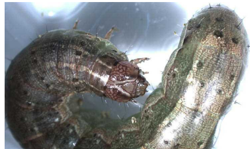
写真2 捕獲された幼虫