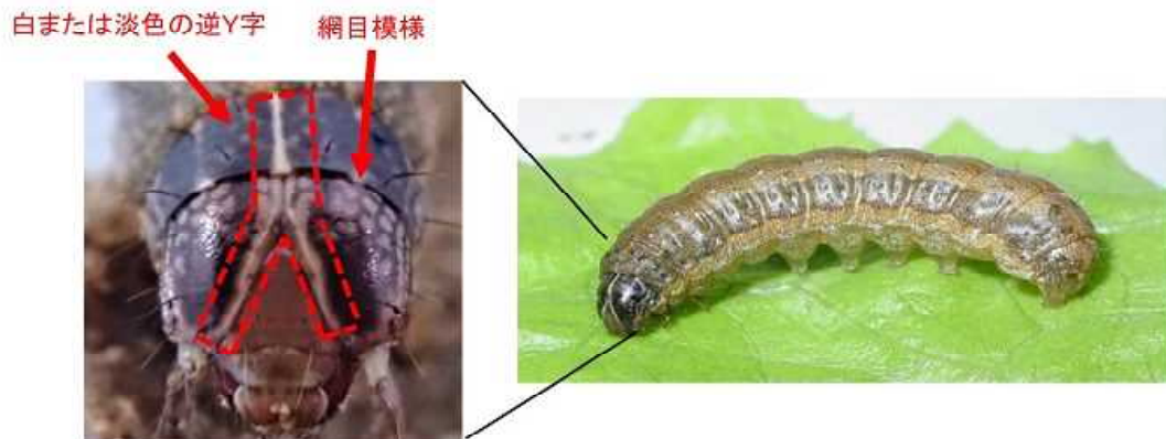
写真4 幼虫（左：頭部、右：全体 体長約40mm） 体色は緑～褐色と多様